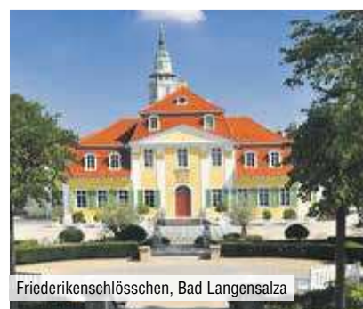
Friederikenschlösschen, Bad Langensalza