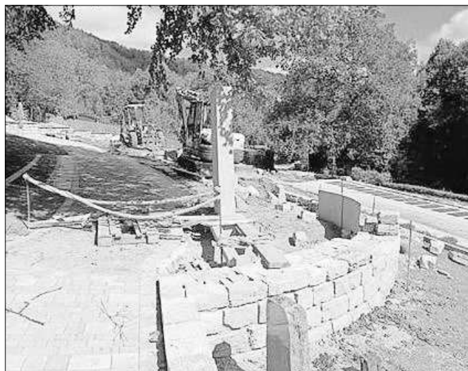
Eine der neuen Stelen für ein Urnengrabfeld.

Unser Foto zeigt an ganz entscheidende Stelle des Friedhofes, an der gerade intensiv gearbeitet wird. Diese leicht ansteigende Wegeführung mit der abschließenden Mauer wird die Umrundung für eines der vorgesehenen Baumgräber des Friedhofes. Am rechten Bildrand wird dann der Baum gepflanzt und nach der Fertigstellung und Gestaltung der Fläche werden die Grablegungen der Urnen für diese neue Begräbnisart möglich sein. Errichtet wurden inzwischen auch zwei Stelen für weitere Urnengrabstätten. An den Stelen können für die in diesem Grabfeld Beigesetzten bronzene Ginkgoblätter mit den persönlichen Daten angebracht werden.