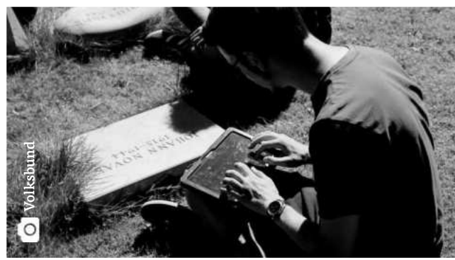
Ausgewählte Erinnerungsorte mit Actionbound-Angeboten des Volksbundes

Die App Actionbound ermöglicht die Erstellung interaktiver Lernparcours – sogenannter Bounds – für mobile Endgeräte. Ausgestattet mit Tablets des Volksbundes, auf denen die App bereits vorinstalliert ist, durchlaufen die Teilnehmenden vielfältige Stationen auf der Kriegsgräberstätte. Die Bildungsinhalte werden durch den Einsatz multimedialer Elemente (Bilder, Videos, Karten, QR-Codes etc.) greifbar und zielgruppenorientiert vermittelt. Die Teilnehmerinnen und Teilnehmer erkunden in Kleingruppen selbstständig die Kriegsgräberstätte – exploratives Lernen und selbstständiges Arbeiten werden gefördert. Die Ergebnisse des Actionbounds werden gemeinsam ausgewertet. Sie bilden den Ausgangspunkt für weiterführende Diskussionen und eine vertiefende thematische Auseinandersetzung.