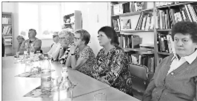
Blicke in die Teilnehmerrunde