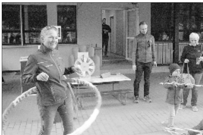
Im Freigelände der Einrichtung hatten Erzieher, Kinder und Eltern Spaß bei Aktivitäten