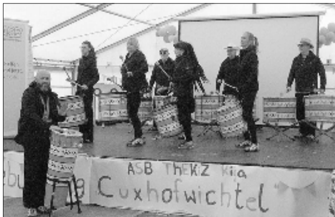
Die Samba Band zauberte eine herrlich rhythmische Stimmung ins Zelt