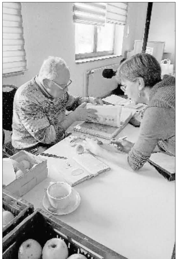
Eindrücke vom „Apfeltag“ 2024

Apfelsorten kennenlernen oder die eigene Ernte hinsichtlich der Sorte bestimmen zu lassen oder Hinweise für die Pflege der Bäume zu erhalten, solche Themen standen im Mittelpunkt des Nachmittags.