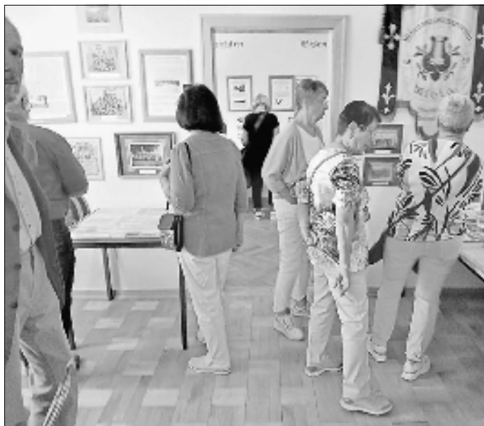
In den Räumen des Museums im Rathaus