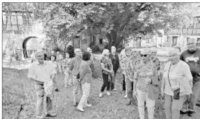
Auf dem Hof des Roten Schlosses