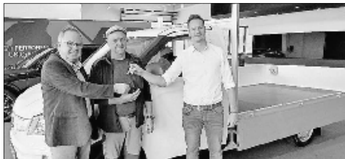
Schlüsselübergabe im Autohaus Amt Creuzburg

Das neue Bauhoffahrzeug ist sicher der Einstieg. Bei weiteren Anschaffungen werden die Möglichkeiten des E-Antriebs nach den dann vorliegenden Erfahrungen eine wichtige Rolle spielen.