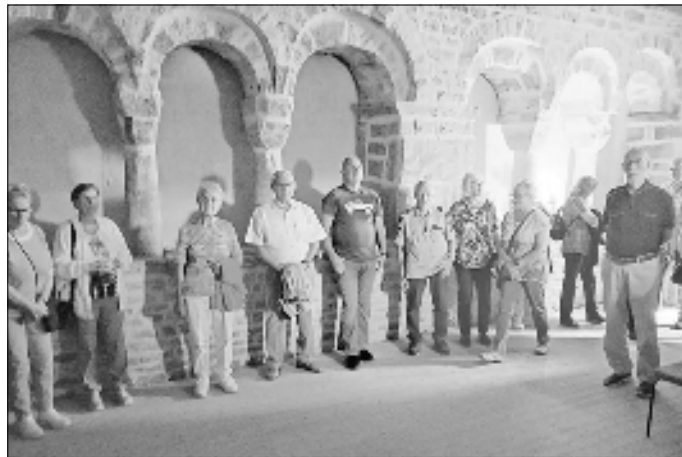
Besichtigung des Arkadenraumes im romanischen Turm der St. Martinskirche

Vielen Dank an alle Organisatoren und Helfer.