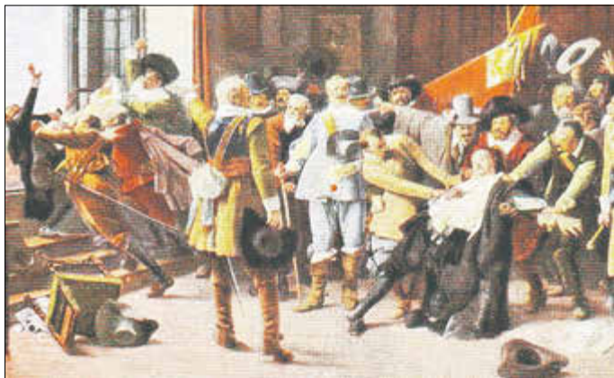
Vertreter der böhmischen Stände dringen am 23. Mai 1618 in die Prager Burg ein und werfen nach alter Sitte drei königliche Beamte aus dem Fenster. Der Fenstersturz zu Prag löste einen Flächenbrand aus, der über 30 Jahre anhalten sollte. Nach einem Gemälde von Brozik aus: Bilder Deutscher Geschichte, Zigarettenbilderdienst, Hamburg 1936, Bild32, Privatbesitz.

Die Fotos stammen aus dem Fotoarchiv Marburg. Die Grundlage für diese Sammlung schuf der Kunsthistoriker Dr. Franz Stoedtner, der 1895 in Berlin das „Institut für wissenschaftliche Projection“ gegründet hat. Es war eines der ersten Lichtbilderarchive, das historische Ereignisse und Bauwerke dokumentiert hat.