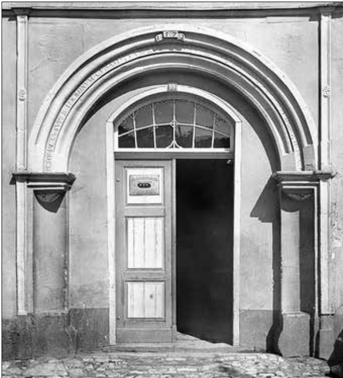
Abbildung 1: Hauseingang am Plan 10

In einem Raum des Hinterhauses fand der jetzige Hauseigentümer, Herr Altenbrunn, ein Kruzifix, aus der katholischen Zeit stammend. Das Vorderhaus ist von Bränden verschont geblieben, während die Hintergebäude wahrscheinlich vom Brande im Jahr 1769 ergriffen wurden [siehe Abbildung 1].