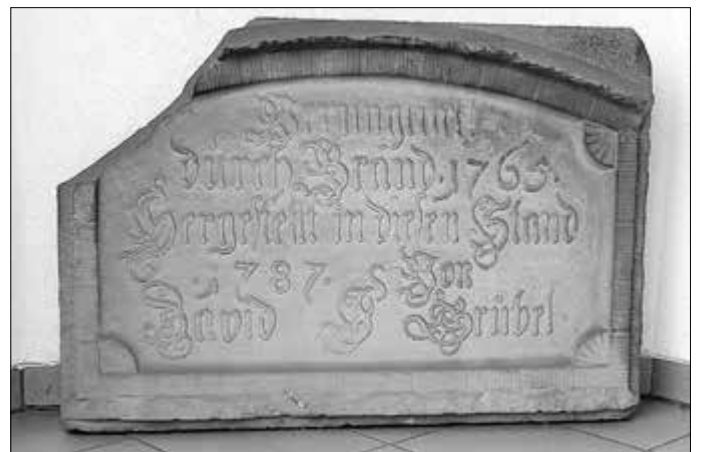
Abbildung 2: Inschrift Klosterapotheke 1787, jetzt vor dem Eingang Klosterapotheke

Die Inschrift/Stein ist erhalten geblieben und befindet sich jetzt vor dem Eingang der Klosterapotheke (siehe Abbildung 2).