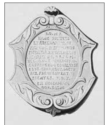
Abbildung 9: Wappen an einem Nebengebäude des Schlosses zu Creuzburg Zeichnung aus der Anna-Amalia-Bibliothek Weimar