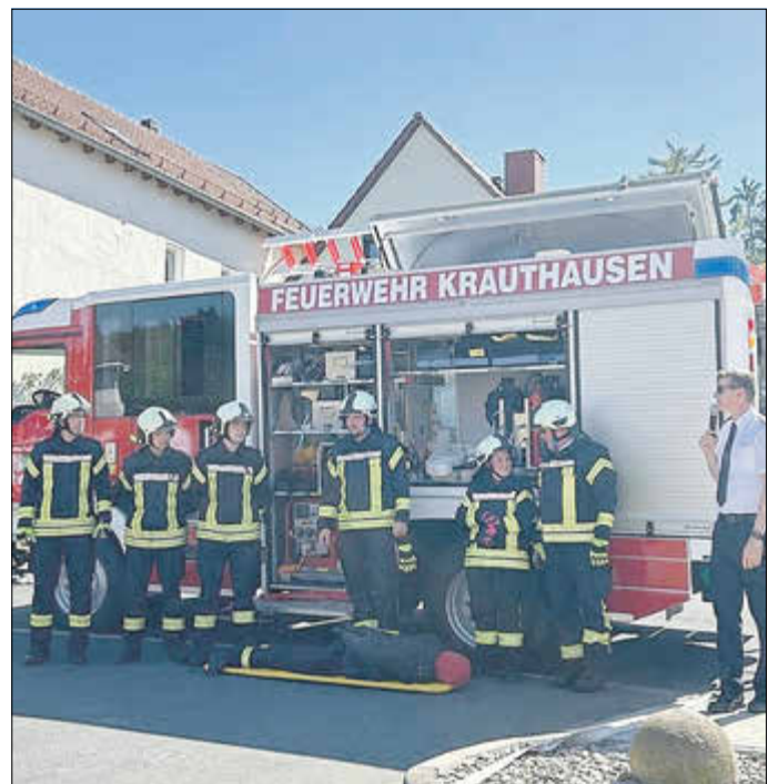
Einsatzübung der freiwilligen Feuerwehr