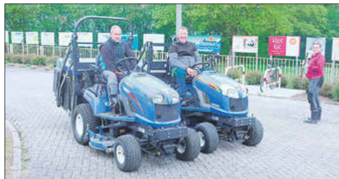
Die Männer vom Bauhof rücken an.