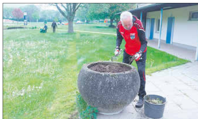
Das Unkraut muss weg.