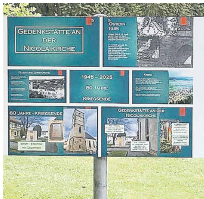
Nun kündigt bis zur Fertigstellung des Erinnerungsortes eine Schautafel vom Vorhaben.