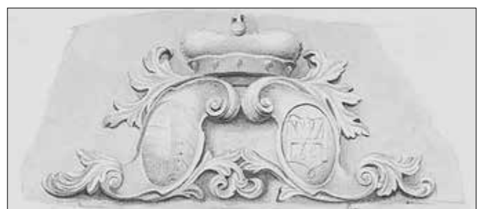
Abbildung 10: Inscript an der Schule in Creuzburg Zeichnung aus der Anna-Amalia-Bibliothek Weimar