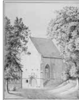
Abbildung 6: Liboriuskirche in Creuzburg Zeichnung aus der Anna-Amalia-Bibliothek Weimar