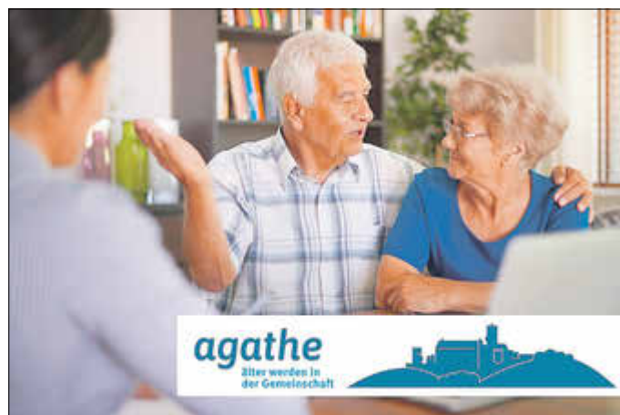
Die AGATHE-Beraterinnen und -Berater beraten zu Themen wie Hilfe im Alltag, soziale Teilhabe und vieles mehr.