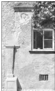
Abbildung 3: Eingang Haus Lange Gasse, jetzt Bahnhofstraße

Umso schöner ist es, dass einige Bauten bzw. Überreste erhalten geblieben sind und, wenn sie nicht mehr existieren, durch die Zeichnungen aus der Anna-Amalia-Bibliothek festgehalten worden sind. Hier noch eine kleine Übersicht weiterer Zeichnungen, deren Bezeichnung in der Bibliothek teilweise nicht korrekt ist. Eine "Eivoriuskapelle" in Creuzburg wäre neu. Eine Korrektur an die Bibliothek in Weimar ist veranlasst.