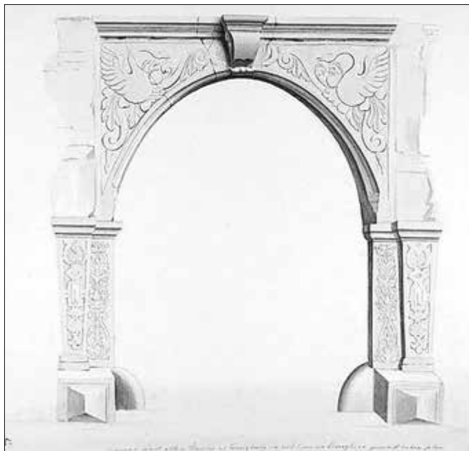
Abbildung 4: Eingang Haus Lange Gasse Zeichnung aus der Anna-Amalia-Bibliothek