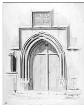
Abbildung 8: Aufgang Gottesackerkirche Creuzburg Zeichnung aus der Anna-Amalia-Bibliothek Weimar