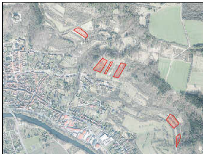
Lageplan der Flurstücke nördlich von Treffurt

Sind Sie Eigentümer oder wissen Sie, wem diese Flächen gehören?