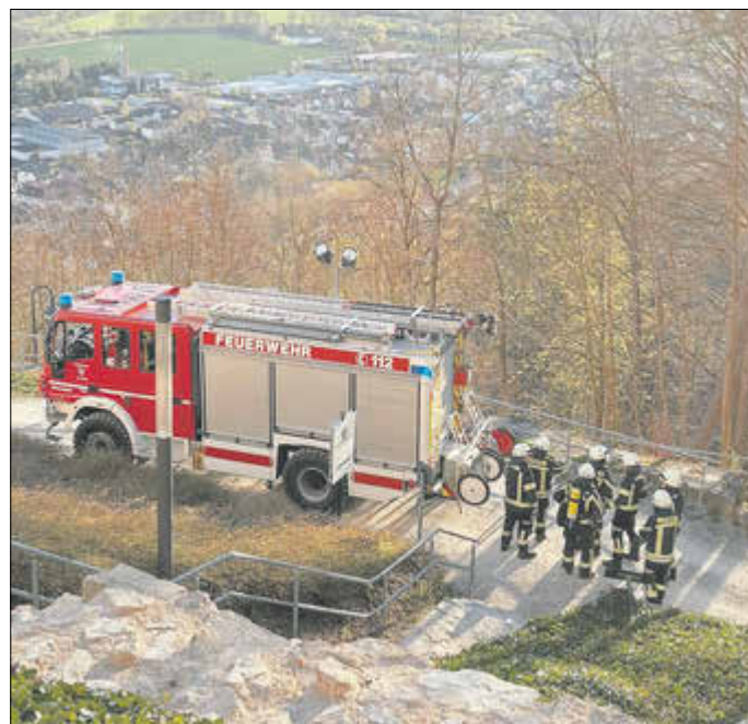
Gemeinsame Osterübung am 7. April 2026 mit der Feuerwehr Wanfried