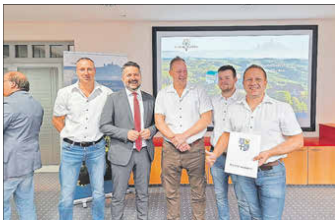
Übergabe der Fördermittel im Rahmen der Sportstättenförderung des Wartburgkreises

Bereits am 14. April 2026 fand die feierliche Übergabe des positiven Bewilligungsbescheides im Rahmen der Sportstättenförderung des Wartburgkreis statt. Der Landrat, Dr. Michael Brodführer, überreichte den Bescheid persönlich an unseren Vorstand. Die Förderung umfasst 25 % der Baukosten.