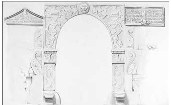
Abbildung 7: Portal der Liboriuskirche in Creuzburg Zeichnung aus der Anna-Amalia-Bibliothek Weimar