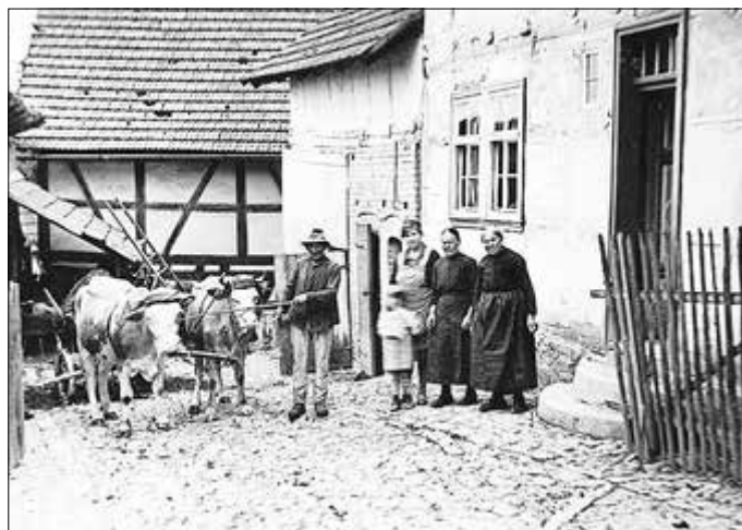
Auf dem Hof Lindenstraße 11, um 1925