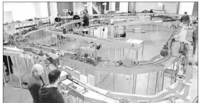
Der Saal der „Goldenen Aue“ hat sich in eine riesige Modellbahnlandschaft verwandelt. Alle Mitglieder sind in emsiger Geschäftigkeit: Gleich wird der fahrplanmäßige Dienstbetrieb beginnen.

Zielstellung des Vereins ist es, die ernsthafte Auseinandersetzung mit der Realität des Eisenbahnbetriebes zu suchen. Um entsprechende Modellstreckenkilometer zu erreichen, werden genormte Modulkästen in Form von End- und Zwischenbahnhöfen sowie Streckenmodulen aneinandergereiht. Dann läuft alles nach einem Fahrplan ab, der von einem Dispatcher koordiniert wird. Dem Gelingen des Zugbetriebs ist am Ende alles untergeordnet. Eine ganz tolle Geschichte, bei der man neben der Disziplin der „Eisenbahner“ aber auch wunderschöne Modelle und Landschaften erleben konnte. Und, nicht zu glauben, die Züge in der „Goldenen Aue“ verkehrten erheblich pünktlicher wie die Originalbahn!