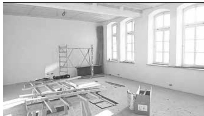
Hier entsteht das große Sitzungszimmer