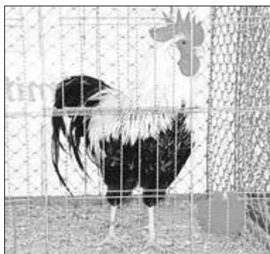
Solch tolle Exemplare wie dieser Hahn präsentierten sich dem Betrachter, insgesamt wurden gut 690 Tiere ausgestellt.

Der Creuzburger Verein ist im Werratal Hauptansprechpartner für die Züchter. In seinen Reihen sind Aktive vor allem aus Trefurt, Falken, Creuzburg und Mihla und dem Lautertal zu finden.