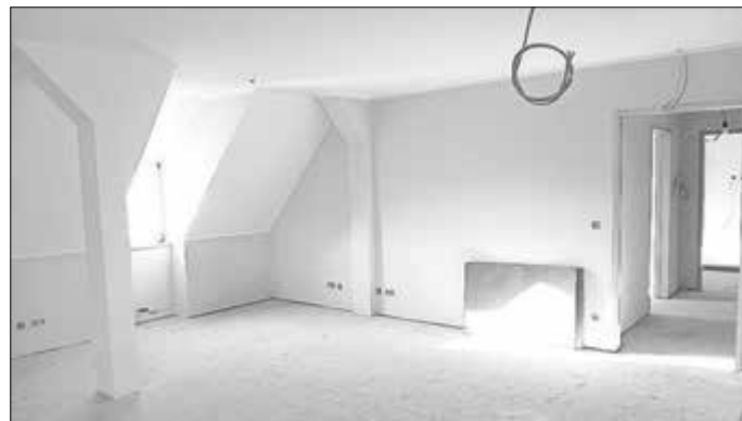
Ein Blick in einen der im Rohbau fertigen Büroräume im Dachgeschoss