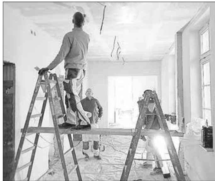
Maler und Putzer in einem der großen Flure

Wenn alles so wie gehofft und geplant funktionieren könnte dann im Juni der Umzug in das neue Verwaltungszentrum umgesetzt werden. Die Eröffnung des Gebäudes soll dann mit den Bau-firmen und der Bürgerschaft mit einem „Tag der offenen Tür“ gefeiert werden.