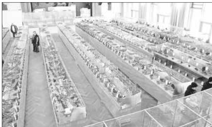
Blick in die Ausstellung auf dem Saal des Creuzburger Klostergartens ...

Tolle Exemplare waren da zu betrachten, die verschiedensten Rassen, die man so wohl nur selten in einer Ausstellung vereint findet. Schon beim Betreten des Klostergartens war das Krähen der Hähne, die sich meist stolz in Positur brachten, nicht zu überhören.