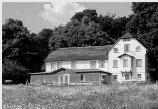
Ziel unserer Wanderung: Das Hainich- Haus bei Kammerforst.

Alle Wanderer und Naturfreunde sind herzlich eingeladen!