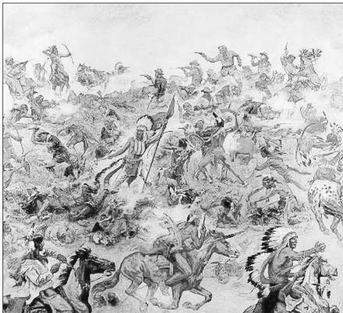
Dieses berühmte Gemälde zeigt den Endkampf am Custerhügel, Indianermuseum in Radebeul

Zwischenzeitlich zog Custer parallel zum Fluss auf erschöpften Pferden nach Norden - und geriet in eine Falle. Als die Kolonne nach links schwenkte, um den Fluss zu durchqueren, versperrte Gall ihr mit 1500 Kriegern den Weg. Sie griffen sofort an. Custer wich aus, wollte die höchste Erhebung der Hügelkette (heute Custer Hill) erreichen, um sich zu verschanzen. In diesem Augenblick erschien Crazy Horse auf der Anhöhe. Hinter ihm mehr als tausend Oglala-Krieger. Sie stürzten sich von oben mit lautem Kriegsgeschrei auf die Kavalleristen, während von unten Gall und seine Hunkpapas heranstürmten. Der Kampf gegen Custer und seine Leute war nach einer knappen halben Stunde vorbei, Custer und 225 seiner Soldaten waren tot und wurden zum Mythos der US-Geschichte.