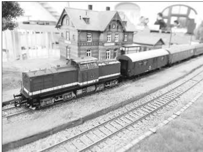
Eine Diesellokomotive der Baureihe BR 110 der DR vor einem Personenzug.

Alles klappte auch in diesem Jahr wunderbar, die Zusammenarbeit der Mitglieder untereinander, mit der Gemeinde und der Betreiberin des Cafés „Glücksmomente“.