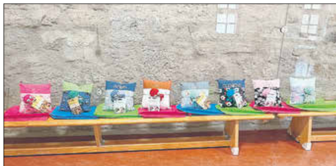
Geschenke für die Babys und ihre Familien