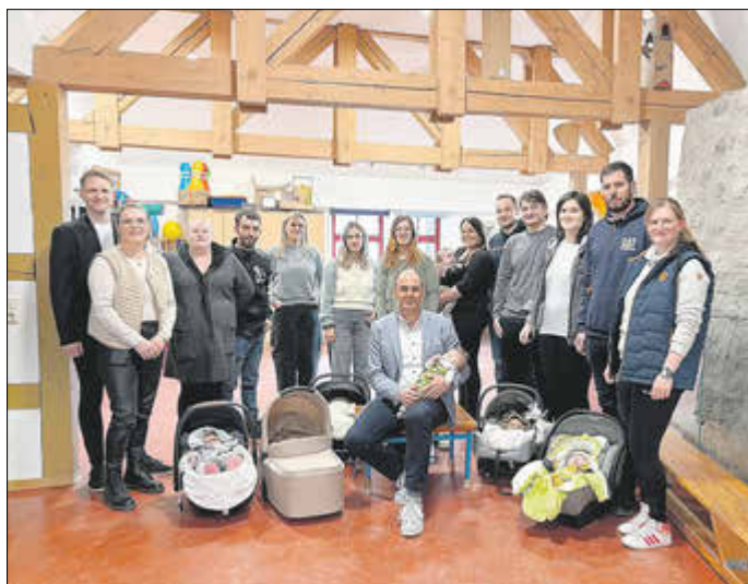
Die frisch gebackenen Eltern begrüßten den Austausch und das neue Format.

Wer sagt eigentlich, dass überall die Geburtenzahlen sinken? In Treffurt scheint das Gegenteil der Fall zu sein - hier herrscht aktuell ganz klar Baby-Boom-Stimmung!