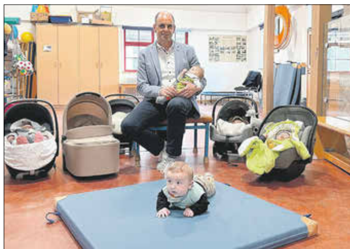
Wer hat hier das Sagen?

Am 26. März 2026 durften wir gleich neun von 13 Neu-Treffurterinnen und Treffurter gemeinsam mit ihren stolzen Eltern in der Kinderkrippe „Kleine Werraspatzen“ begrüßen. Ein Raum voller meist schlafender Babys, glücklicher Gesichter und ganz viel Zukunft!