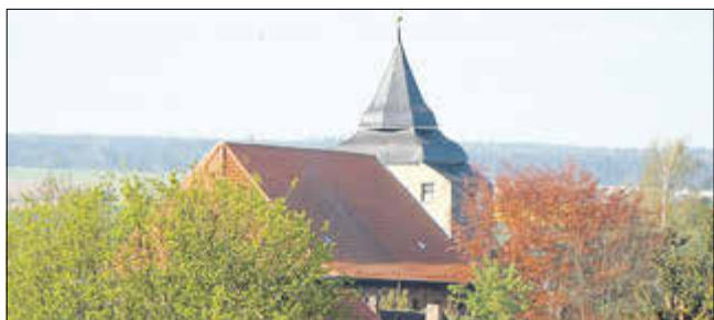
Frühlingsblick auf die Mihlaer St. Martinskirche

Endlich ist es soweit: Der Winter hat sich zurückgezogen und die Frühlingsblüher legen los. Mit viel Verspätung, ein langer und nicht enden wollender Winter hatte uns bis in die Ostertage im Griff. Nun geht es aber los mit dem Frühling, mit sehr viel Kraft, wie überall zu erleben ist.