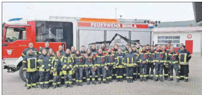
Gruppenfoto der Teilnehmerinnen und Teilnehmer am Truppmann-/ frau Lehrgang - Teil 1

Die Teilnahme am Lehrgang war durchgehend sehr hoch, was das große Engagement und die Motivation der angehenden Einsatzkräfte widerspiegelt. Im Rahmen von insgesamt 70 Ausbildungsstunden wurden den Teilnehmerinnen und Teilnehmern grundlegende Kenntnisse und Fähigkeiten für den Feuerwehrdienst vermittelt.