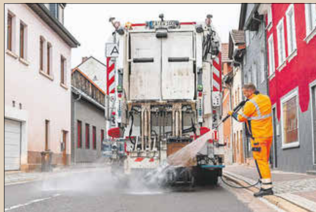
Das Waschfahrzeug des Abfallwirtschaftszweckverbandes Wartburgkreis - Stadt Eisenach (AZV) im Einsatz

Für die Bürgerinnen und Bürger ändert sich bei der Bereitstellung der Biotonnen nichts, im Gegenteil: Die Behälter sollen wie gewohnt, unabhängig vom Befüllungsgrad, zur regulären Biomüllabfuhr bereitgestellt werden. Ein konkreter Termin für die Reinigung einzelner Behälter kann nicht angegeben werden.