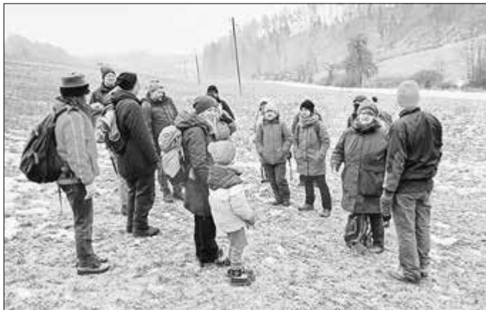
Besprechung der Veranstaltung im Mihlaer Tal.