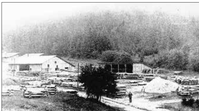
Die bisher einzige bekannte Fotografie des alten Sägewerkes im Mihlaer Tal, auf dem „Alten Feld“, aufgenommen 1917