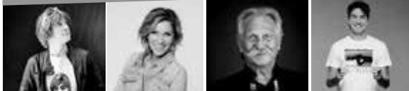
Mickie Krause, Anna-Maria Zimmermann, Henning Krautmacher und Comedian Matze Knop