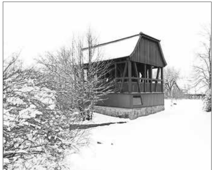
Das Glockenhaus auf dem alten Mihlaer Kirchhof