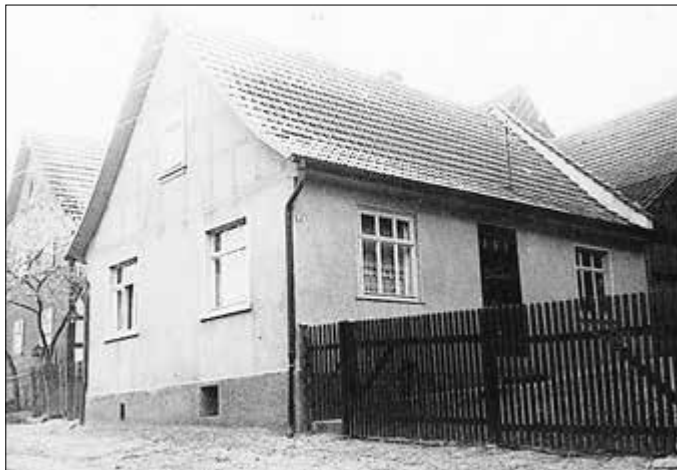
Wohnhaus Lindenstraße 14, um 1935