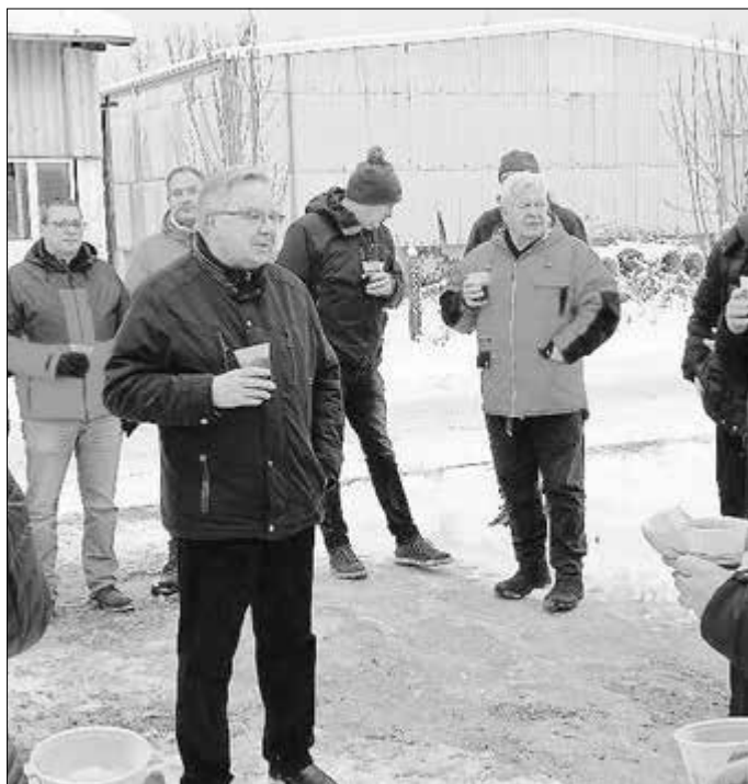
Bürgermeister Rainer Lämmerhirt bei seiner Ansprache.