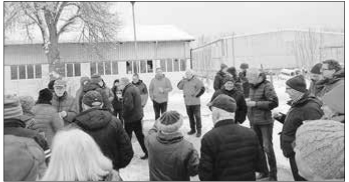
Trotz heftigsten Winterwetters hatten sich viele Zuschauer am neuen Gedenkstein eingefunden.

Trotz der winterlichsten Bedingungen kamen aber ausreichend Zuschauer, die die Einweihung des Gedenksteines erleben wollten. Beinahe alle Stadträte und Ortsteilbürgermeister, neugierige Bürgerinnen und Bürger und zahlreiche Mitglieder des Mihlaer Heimatvereins fanden sich ein.