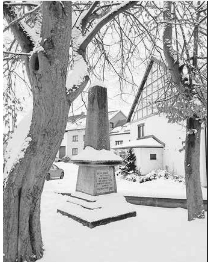
Das Denkmal für die im Krieg gegen Frankreich 1870 gefallenen Mihlaer im tiefen Weiß