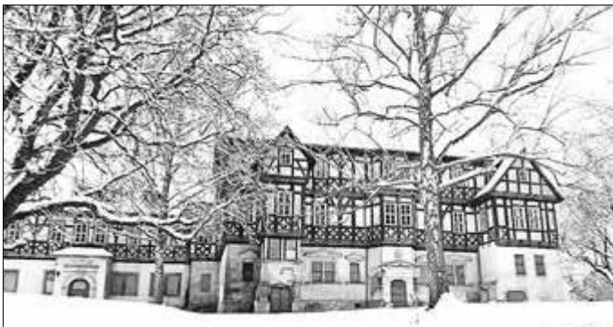
Ungewohnter Anblick: Das Mihlaer Rote Schloss im Winter

Bei einem Streifzug um die Mihlaer Kirche entstanden die nachfolgenden Winterbilder.