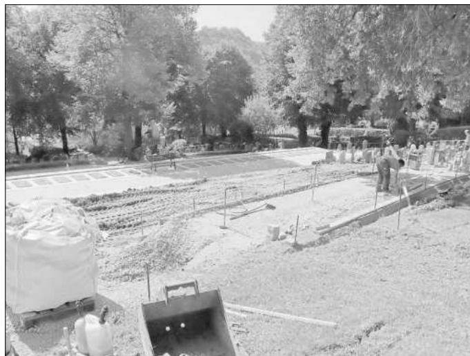
Der Umbau des Creuzburger Friedhofes geht gut voran.