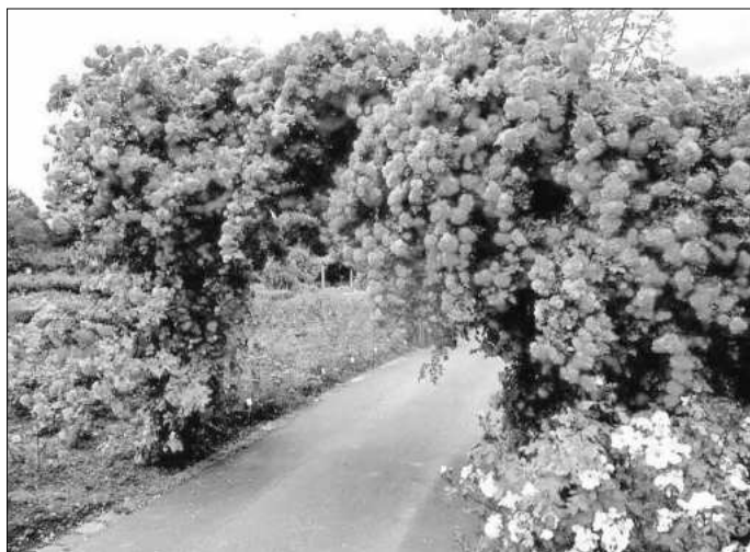
Im Rosengarten gibt es z.Zt. eine blühende Pracht.

Werner Nowatzky Heimatverein Krauthausen e.V. Seniorengruppe