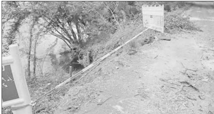
Wenn nicht rasch gehandelt wird, rutscht der restliche Weg in die Werra.

Vorbildlich dabei die Unterstützung durch das Landwirtschaftliche Unternehmen.