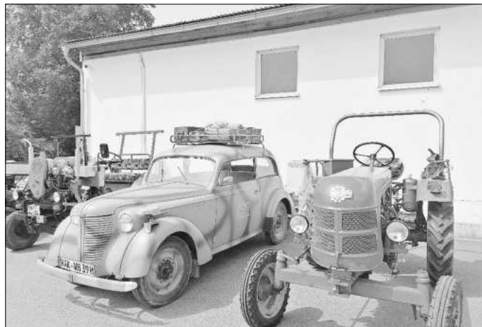
Ein Blick auf die einen Ausschnitt der Technikschaу.

Insgesamt ein toller Tag, vielen Dank allen Organisatoren und Mitstreitern!