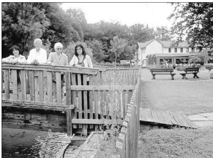
Das Umfeld des „Harth-Hauses“ lädt zum Verweilen ein.