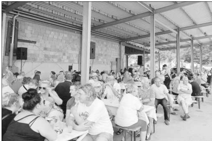
Ein Schattenplätzchen war am diesem Samstagnachmittag gefragt.