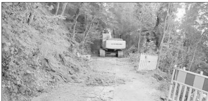
Daher wird nun mit schwerer Technik am Weg gearbeitet.