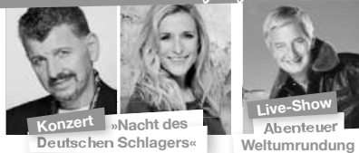
Konzert »Nacht des Deutschen Schlagers«