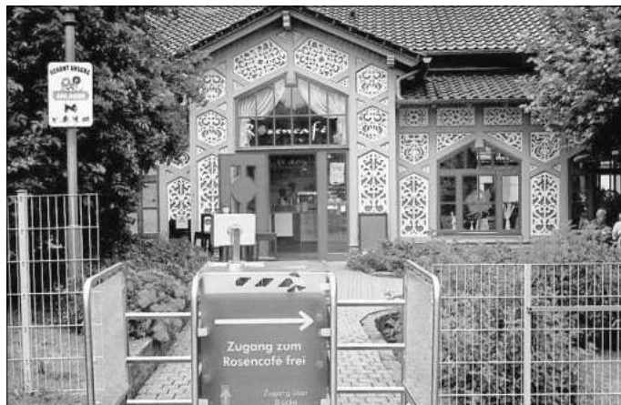
Kaffee und Kuchen gab es im „Rosencafé“.