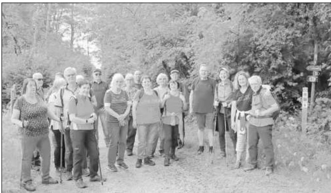
Ein Teil der Wandergruppe unweit des Eschenborns.