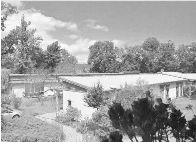
DRK Pflegeheim im Grünen, Mihla