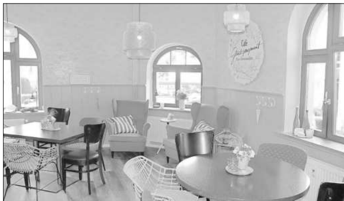
Ein Blick in das Innenleben des neuen Cafés.

Carolin Beck aus Ütteroda hatte schon vor einigen Monaten beschlossen, sich nun einen Lebenstraum zu erfüllen: Ein eigenes Café mit ganz besonderen Torten- und Kuchenangeboten. Nach ersten Gesprächen mit der Stadt Amt Creuzburg und deren Verantwortlichen sowie den Vereinen, die die Aue seit vielen Jahren als Domizil nutzen, verfestigte sich dieser Wunsch und wurde nun zur Realität.