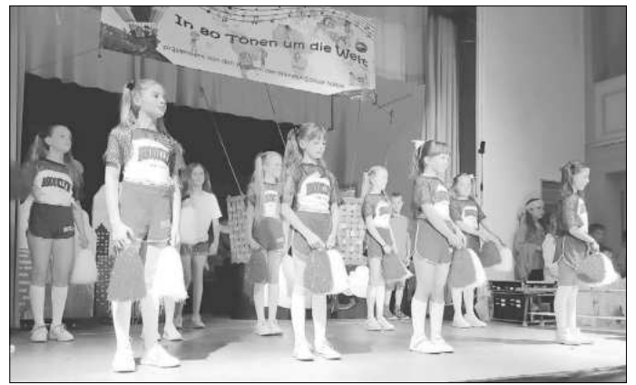
In den USA. Cheerleaders begrüßen die Ballonfahrer