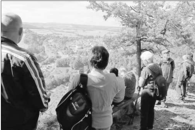
Blick von den Ebenauer Köpfen auf das Werratal mit Creuzburg.

Insgesamt 31 Teilnehmer wurden dann von der Besatzung des Creuzburger Grills mit dem Mittagessen versorgt. Besten Dank! Es hat allen Teilnehmern sehr gut geschmeckt. Ja, und dann ging es mit den Taxibussen wieder zurück nach Mihla. Eine gelungene und erlebnisreiche Wanderung des Mihlaer Vereins in den benachbarten Ortsteil.