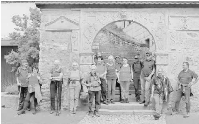
Am Gottesackertor in Creuzburg.