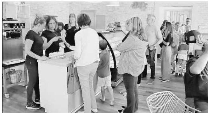
Am Kuchenbüffet waren Schlangen angesagt.

Geöffnet ist das Café „Glücksmomente“ in der Goldenen Aue am Dienstag von 10.00 Uhr bis 17.00 Uhr, am Mittwoch von 10.00 Uhr bis 14.00 Uhr, am Donnerstag und am Montag ist Ruhetag, Freitag sind die Türen von 10.00 Uhr bis 17.00 Uhr und am Wochenende jeweils von 11.00 Uhr bis 17.00 Uhr offen.