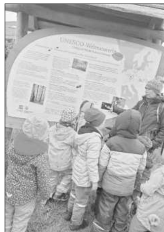
Die Wildkatzen des ASB ThEKiZ Kindergarten Cuxhofwichtel

Nach vielen spannenden Entdeckungen kamen wir wieder zum Ausgangspunkt unserer Wanderung. Ein kurzes Gruppenbild unter unserer Namensgeberin der Wildkatze, anschließend eine kleine Stärkung und schon spielten wir ausgiebig auf dem Spielplatz. Wenig später kamen auch schon die Taxibusse und es ging zurück zum Kindergarten. Schon geht unser lehrreicher, aufregender Vormittag zu ende.