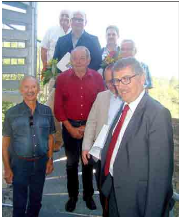
Die diesjährigen Preisträger mit dem Landrat.