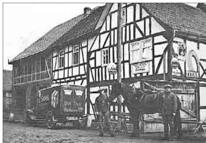
Bäckerei Adam Wagner

Mittlerweile bahnte sich in 1833 eine Partnerschaft zwischen Sachsen-Weimar und Preußen an: Der „Zoll- und Handelsverein der Thüringischen Staaten“, dessen Mitglied das Herzogtum geworden war, vertrat dann ab dem 1.1.1834 im neuen „Deutschen Zollverein“ - ein Zusammenschluss der meisten Länder des Deutschen Bundes - die Interessen aller Thüringer Staaten. Alle Zoll- und Handelschranken waren jetzt gefallen. Ohne Zweifel war dieses Datum auch ein wichtiger Schritt auf dem Weg zum Zusammenschluss der beiden Ortsteile.