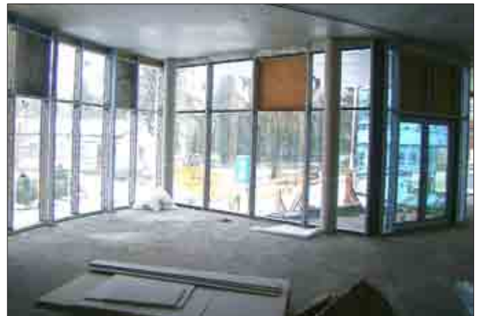
Im neuen Eingangsbereich Mitte Januar 2017.

Planzeichnung des neuen Gebäudes vom Schulhof her. Über die Treppe wird der Pausenhof erreicht. Gleichzeitig kann der verglaste Bereich als Aula genutzt werden und bekommen die dort liegenden Räume sehr viel Licht. Über dem Neubau entsteht ein verglaster Übergang zwischen Alt- und Neubau.