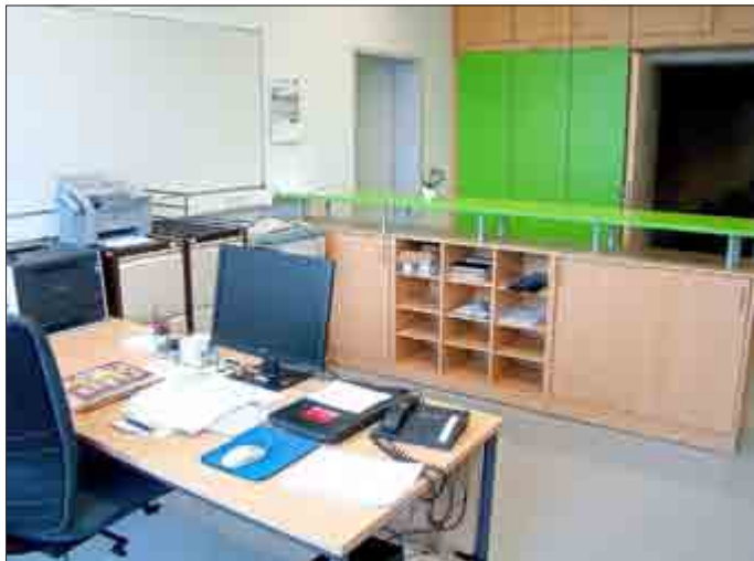
Bezogen und mit neuen Möbeln gestaltet wurde bereits der dringend benötigte Bereich des Schulsekretariats. Hier der Arbeitsplatz der Schulsekretärin.