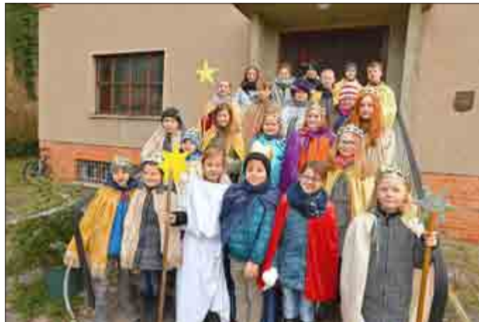
Die Sternsinger 2016, Foto: Heiko Kleinschmidt/ Thüringer Allgemeine

Weitere Hinweise auf Gemeindeveranstaltungen finden Sie im Internet unter www.ev-kirche-treffurt.de und im Gemeindebrief und Gemeindeblatt.