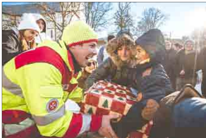
Ein ehrenamtlicher Mitarbeiter der Johanniter-Unfall-Hilfe übergibt Päckchen an ein Kind