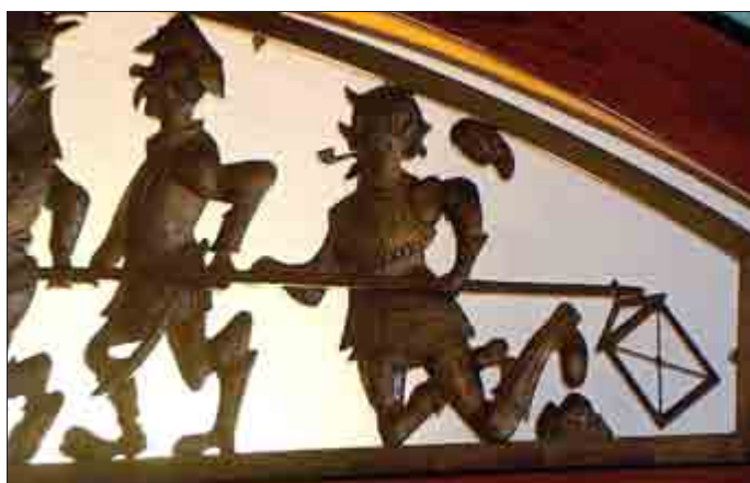
Zum Schluss dann der Veitli, wohl der „Tapferste“ der Schar. Wer könnte hier das Vorbild gewesen sein?