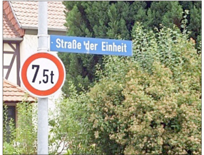
Fronstraße/Straße der Einheit

Rund hundert Jahre später wurde die letzte Phase des Zustandes als Dorf unter zwei Herren mit dem Ende des Ersten Weltkriegs eingeläutet: Die Monarchie endete im Großherzogtum am 9. November 1918. Und so wurde aus dem „Großherzogtum Sachsen - Weimar - Eisenach“ zuerst der „Freistaat Sachsen-Weimar- Eisenach“, der alsbald am 1. Mai 1920 in dem an diesem Tag neugegründeten Land Thüringen aufging. Der letzte Schritt zum staatlichen Zusammenschluss Thüringens ist dann nach dem Zweiten Weltkrieg möglich geworden, da als Folge der Auflösung Preußens die Grenzen völlig neu und in etwa so gezogen werden konnten (und mussten), wie sie den heutigen Freistaat umschließen. Und der Landtag dieses damals neu gebildeten Staats verabschiedete ein Gesetz, mit dem zum 1. Juli 1946 die Vereinigung der beiden Ortsteile von Schnellmannshausen und ihre Zugehörigkeit zum Kreis Eisenach beschlossen wurden. An dieses Datum erinnert heute ein Straßenschild „Straße der Einheit“ in der Mitte des Dorfes; dieser Name ist nicht etwa von den Ereignissen im November 1989 abgeleitet, sondern die frühere „Fronstraße“, wo die Grenze zwischen den Ortsteilen verlief, ist bereits im Jahr 1946 so umbenannt worden.