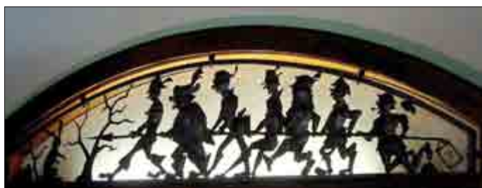
Die Mihlaer Sieben Schwaben, gemeinsam den Spieß gegen das Untier, den Hasen, voran tragend.

Wer diese Charaktertypen erleben möchte, muss nicht gleich zum Märchenbuch greifen. Im Mihlaer Grauen Schloss sind sie seit über 40 Jahren über der Theke aus Metall gefertigt. Ein Meisterstück der alten Dorfschmiedekunst!