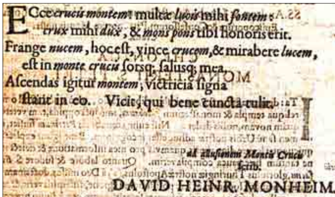
Abb. 3 Paullini/Craemer, Chronika monasterii S. Petri, Einleitung