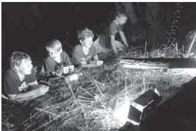
Nachtaufnahmen am „Umsetzer“ im Sommer 2015

Weitere Informationen und das Anmeldeblatt gibt es unter jugend.treffurt.de . Anmeldung sind noch bis 30.01. möglich.