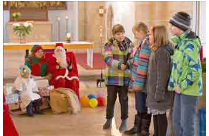
Krippenspiel 2016 in Treffurt

Großburschla - Falken - Schnellmannshausen - Treffurt