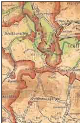
Der nachträglich hinzugesetzte Grenzverlauf

Die Kleinstaaterei in Thüringen war bekanntlich im Laufe der Zeit zu höchster Blüte gelangt, bestanden doch auf der Fläche des heutigen Freistaats am Anfang des 20. Jahrhunderts immerhin acht Kleinstaaten, einige preußische Gebiete in mehreren Regierungsbezirken und einige kleine sächsische Exklaven. Die Zersplitterung wurde dadurch noch verschärft, dass die kleinen Staatsgebilde nicht geschlossene Territorien bildeten, sondern ein in sich zerrissenes und verwirrendes Bild boten. Ein am westlichen Rand des Wartburgkreises gelegener Ort hat im Laufe der Jahrhunderte diese Thüringer Besonderheit mal mehr, mal weniger intensiv als lästiges Übel aushalten müssen: Schnellmannshausen, heute ein Stadtteil von Treffurt. In west-östlicher Richtung teilte eine Grenze den Ort in das thüringische „Oberdorf“ und das preußische „Unterdorf“. Wenn man genau hinsieht, sind Spuren dieser Teilung heute noch zu sehen.