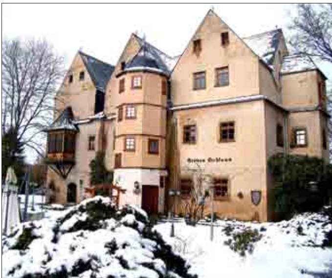
Das Graue Schloss im Schnee, ein bezogen auf die letzten Winter seltener Anblick.

Die Mitarbeiter des Bauhofes begannen mit voller Mannschaft am frühen Samstagmorgen ihren Betrieb. Am Wochenende waren auch die meisten Grundstückseigentümer zu Hause und konnten so ihrer Räumspflicht nachkommen. Mitunter ist hier, vor allem bei älteren Menschen, auch die Nachbarschaftshilfe gefragt. Nach drei schneearmen Wintern funktioniert diese hoffentlich auch noch... Und dann begann gleich am ersten Schneetag die unendliche Geschichte der Auseinandersetzung, wer kommt zu erst, der Schneeflug oder der Besen? Die Männer des Bauhofes müssen die Straße schieben, da, wo es eng zugeht, werden vielleicht die gerade geräumten Gehwege wieder zugeschoben... Eine Lösung ist nur in Sicht bei gegenseitiger Rücksichtnahme. Wenn die Straßen nicht geräumt sind, laufen sehr schnell die ersten Beschwerden ein.... Nur gut, dass es solche Winter bei der angeblichen Erderwärmung nicht mehr zu oft geben soll. Was war nur früher?