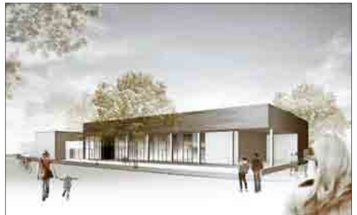
Sanierung Bürgerhaus Kloostergarten msp ARCHITEKTEN

Die Baumaßnahmen zur Sanierung des Bürgerhauses werden durch Fördermittel aus dem Bund-Länder-Programm der Städtebauförderung BL-FI zur Förderung der Innenentwicklung der Städte und Gemeinden bezuschusst.