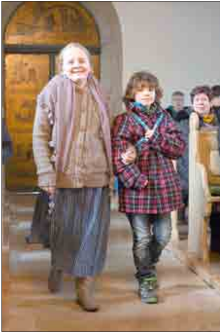
Krippenspiel 2016 in Treffurt

Großburschla - Falken - Schnellmannshausen - Treffurt