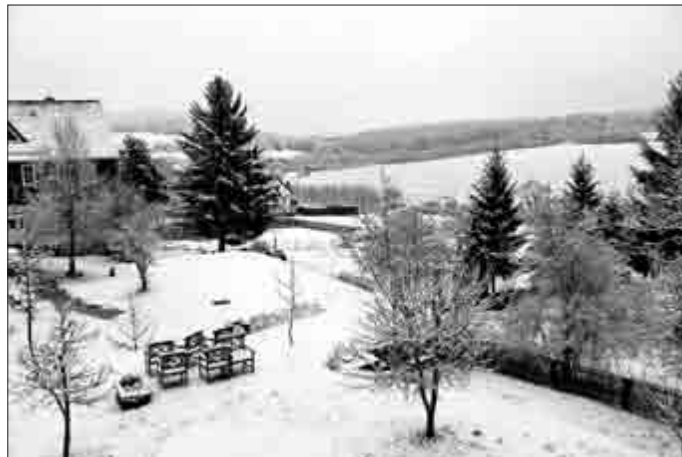
1. April: Ein später Wintergruß nach einem insgesamt schneearmen Winter.

Alle Spielansetzungen und Ergebnisse - regional wie überregional - finden Sie unter: www.fussball.de .