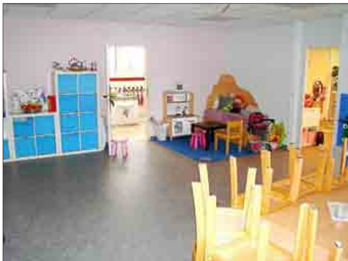
Einer der fertig gestellten Gruppenräume. Er wird bereits wieder genutzt.

Nun sind die ersten Gruppenräume fertig gestellt und werden wieder genutzt. In den anderen wird durch mehrere Firmen gleichzeitig gearbeitet. Die Fluchttüren sind eingebaut und noch vor dem Frost konnten etliche der Fundamente für den Außenanbau der Galerie in die Erde gebracht werden. Diese Arbeiten sollen zuletzt ausgeführt werden, Vorrang hat jetzt der Abschluss des Innenausbaus.