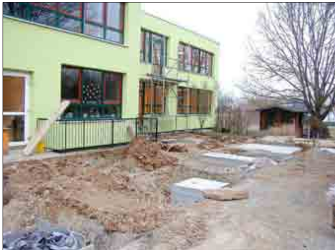
Die Fluchttüren zur späteren Außengalerie sind eingebaut. Noch vor dem Frost wurden bereits etliche Fundamente fertig gestellt, auf die dann die Trägerkonstruktion für die Galerie, die als zweiter Fluchtweg ausgelegt ist, errichtet werden.

Geplant war ein gutes Jahr für die Bauarbeiten zur Umsetzung des Brandschutzkonzeptes im Gebäude der „Cuxhofwichteln“, der Kita der Gemeinde, in Trägerschaft des ASB. Nun sind bereits über die Hälfte der Bauarbeiten abgeschlossen, bei laufendem Kindergartenbetrieb, sicher eine große Herausforderung für die Erzieherinnen und auch für die Eltern. Aber andere Alternativen wie Umzug oder Schließung standen von Anfang an nicht zur Diskussion, waren aus verschiedenen Möglichkeiten nicht umsetzbar.