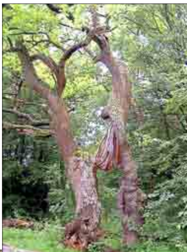
Die Betteleiche, das Symbol des Hainichs, erinnert an die vorreformatorische Klausur Ihlefeld und die Zugehörigkeit der Siedlung zum Eisenacher Katharinenkloster. An dieser Eiche legten, so die Überlieferung, Reisende als Dankopfer Gaben für die Bettelmönche nieder.

Nach der Reformation nutzten die Herren von Hopffgarten das Ihlefeld als Vorwerk und betrieben dort Forsthäuser. Die Betteleiche, das Ihlefeld, die Ausfluggaststätte Reckenbühl, aber auch die Steindenkmale zählen mit ihrer eindrucksvollen Geschichte zu den touristischen Höhepunkten im Weltnaturerbe Hainich.