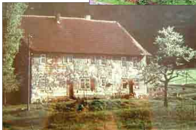
Das alte Reckenbühl, Gemälde, Kopie im Ortsarchiv Mihla.