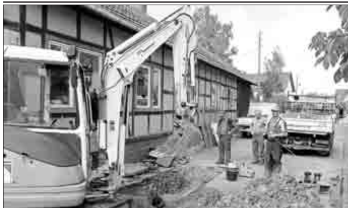
15. Juli: Nach einem Rohrbruch in der Schloßstraße hatte sich über Nacht der Hochbehälter entleert. Die Lokalisierung der Schadstelle gestaltete sich schwierig, Teile des Ortes waren bis zum Abend ohne Wasser.