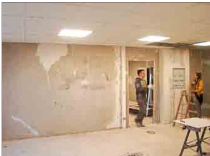
Rohausbauarbeiten in einem der Räume, die nun neu gestaltet werden.

Nun sind die ersten Gruppenräume fertig gestellt und werden wieder genutzt. In den anderen wird durch mehrere Firmen gleichzeitig gearbeitet. Die Fluchttüren sind eingebaut und noch vor dem Frost konnten etliche der Fundamente für den Außenanbau der Galerie in die Erde gebracht werden. Diese Arbeiten sollen zuletzt ausgeführt werden, Vorrang hat jetzt der Abschluss des Innenausbaus.