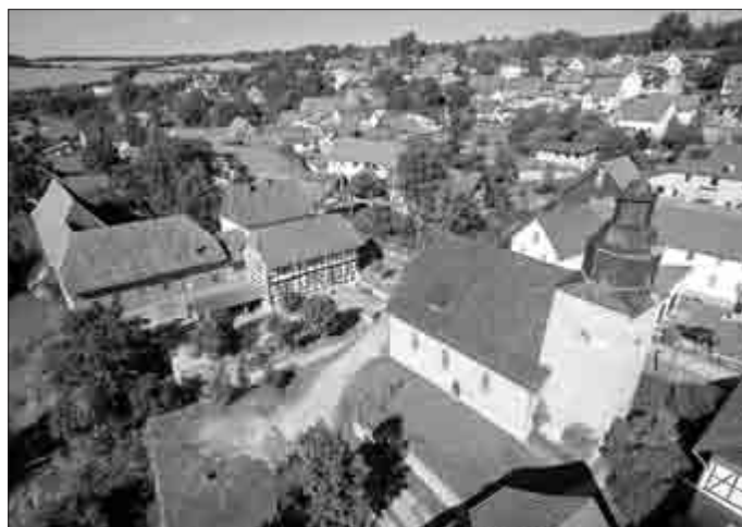
21. September: Blick über den Kirchhof nach Nordwesten.