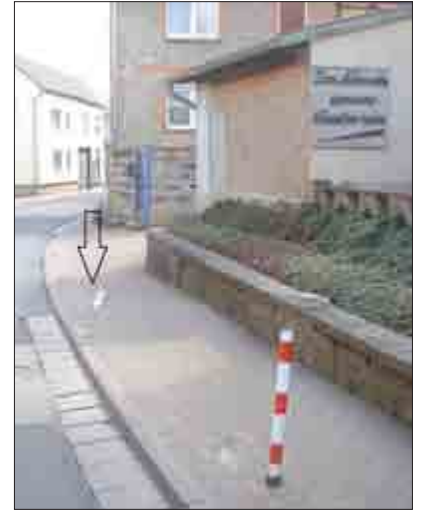
Zum wiederholten Male umgefahren, dieses Mal aber völlig; der Poller in der Neustadtstraße.